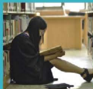
在图书馆阅读的毕业生