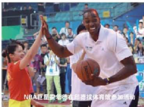
NBA巨星詹姆斯在邱德拔体育馆参加活动

常舒服。邱德拔的好处是器材新、空间大、空气相对康美乐健身馆好。我办了年卡，一年900元，所以平均下来也很便宜。不过有时候人多了点，就会选择时间避开人群。”