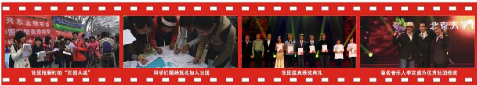
社团迎新时的“百团大战”