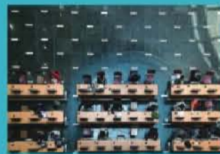
图书馆阳光大厅计算机使用区