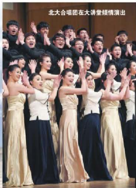
北大合唱团在大讲堂倾情演出

每到讲堂举办活动或放映影片时，总有一批志愿者维持秩序，疏散人群。讲堂对于他们而言，便不仅仅是一个演出场所，而有了另外一种特殊的意义。志愿者曾写道：“讲堂是北大人的讲堂，每个北夫人都热爱它，里面有他们喜欢的电影或者话剧、歌剧或者音乐会，这里将枯燥的学习生活和丰富的艺术世界连接到了一起。每次演出结束后观众们站立起来鼓掌，躲在黑暗中的我们也有深深的自豪感。每次上岗都按部就班地经历换衣服、开会、取装备、到岗服务、结束总结等等一系列的工序，但是也有我们的嬉笑怒骂，以及属于我们自己的快乐与情谊。我们称这个地方为‘大房子’，在北大这个陌生的园子里，有一个属于自己的可以遮风挡雨的房子似乎是心里最值得安慰的事情。房子里有我的‘哥哥姐姐’，也有我的‘弟弟妹妹’，我们一起吃饭，一起出去玩，似乎我的记忆中已经完全是和他们在一起的片段，背景是那个大房子，现在我把它叫做家。”