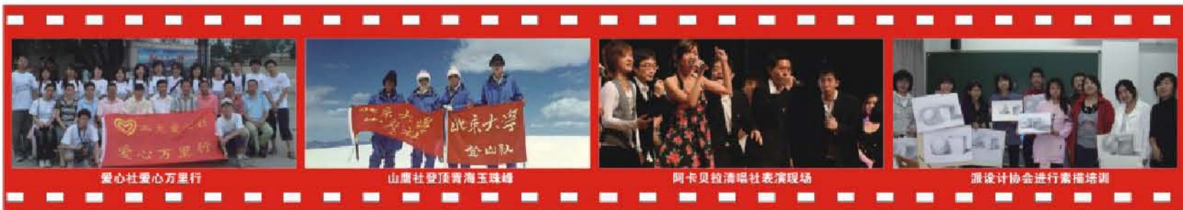
爱心社爱心万里行

对于巧遇设计，对其感兴趣的人，“派”是可以寻求志同道合者、安心做自己喜欢事情的地方。而对于那些想要从事设计，并为之奋斗一生的人，“派”将是他们施展无限潜力的地方和永恒的精神家园。