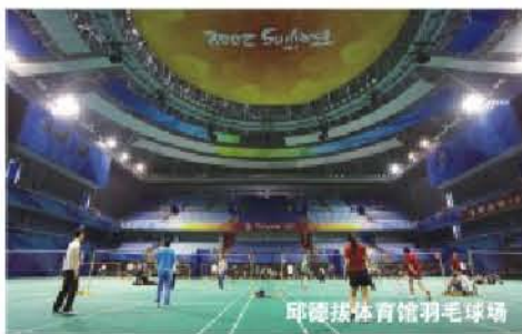
邱德拔体育馆羽毛球馆

为了回馈学校师生，体育馆还与学生资助中心合作，每年为贫困家庭学生免费提供400张左右的游泳健身卡。